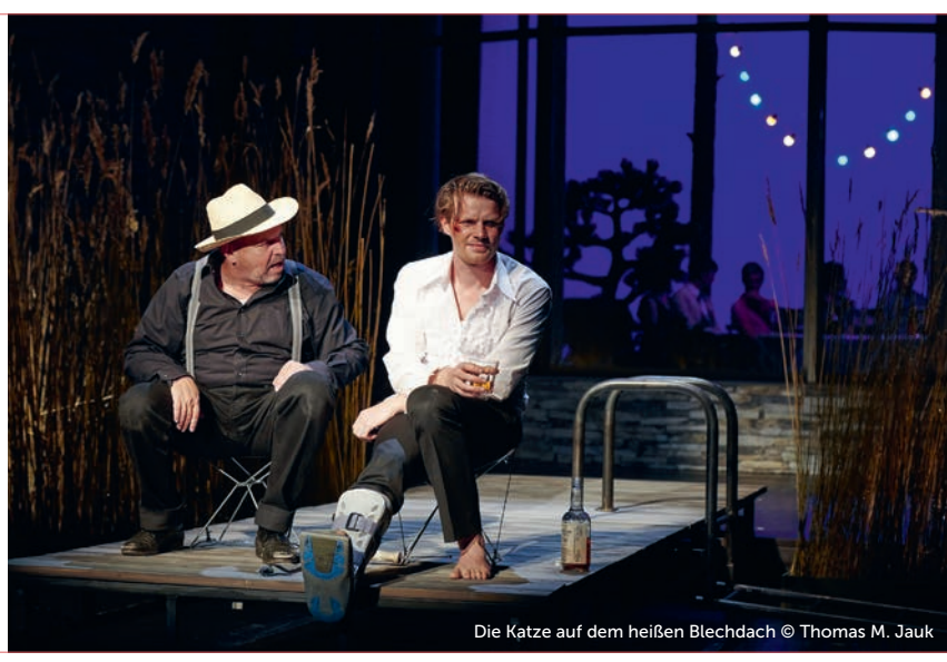
Die Katze auf dem heißen Blechdach

MI 04.03. Graf-Zeppelin-Haus 33 / 26 / 18 / 11 € Die Katze auf dem heißen Blechdach von Tennessee Williams Steffi Kühnert Regie Hans Otto Theater, Potsdam 19:00 Einführung AbO 19:30